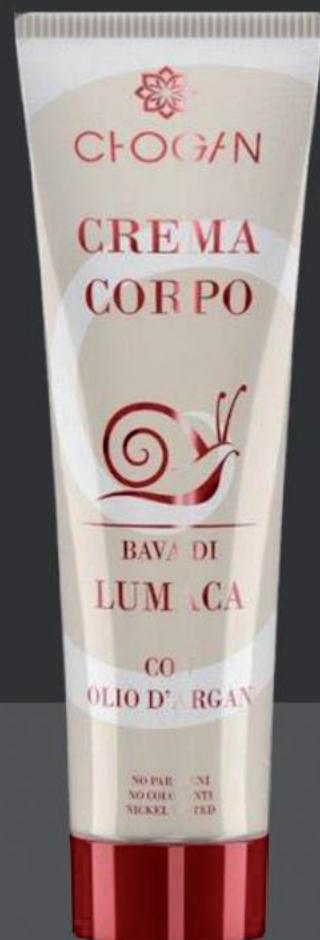
CR24 Körpercreme mit Arganöl