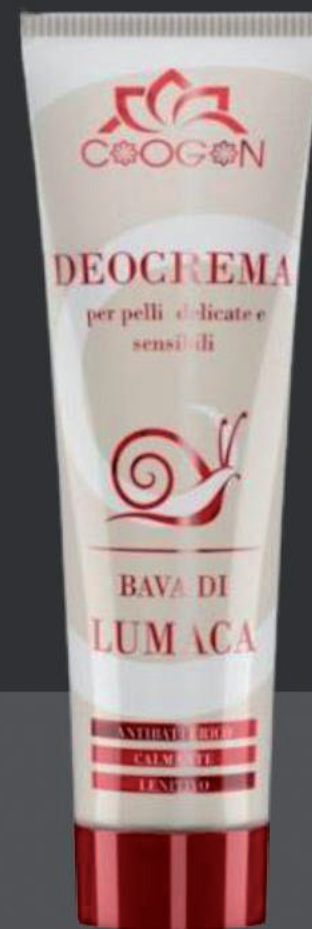
BV11 Deo Creme